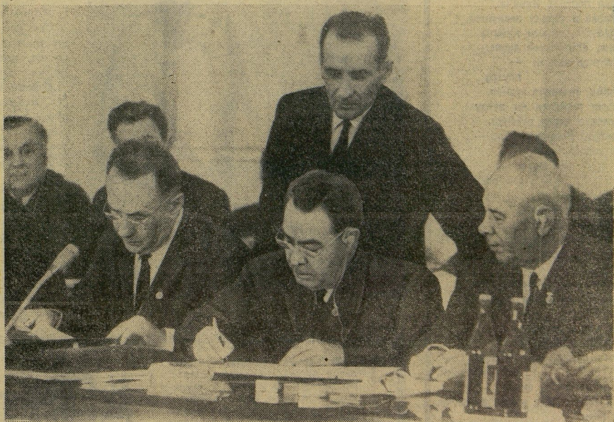
Москва, 17 июня 1969 г. Международное Совещание коммунистических и рабочих партий. На снимке: Основной документ Совещания подписывает глава делегации КПСС, Генеральный секретарь ЦК КПСС л. И. БРЕЖНЕВ.

ВОПРОС. Какие проблемы обсуждали представители коммунистических и рабочих партий в Москве и какое значение имеет это Совещание для судьбы мира?