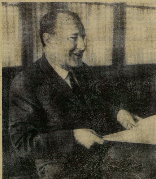
Товарищ Кадар даёт интервью.